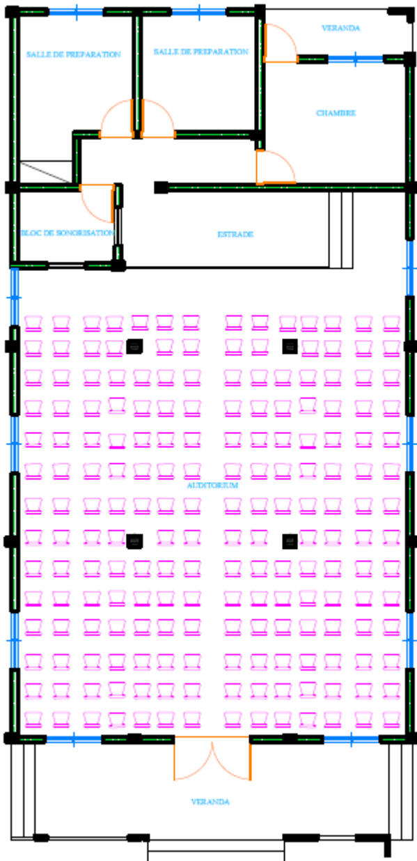
PLAN DE DISTRIBUTION